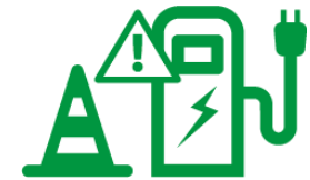
Defecten in laadpaal of andere systemen